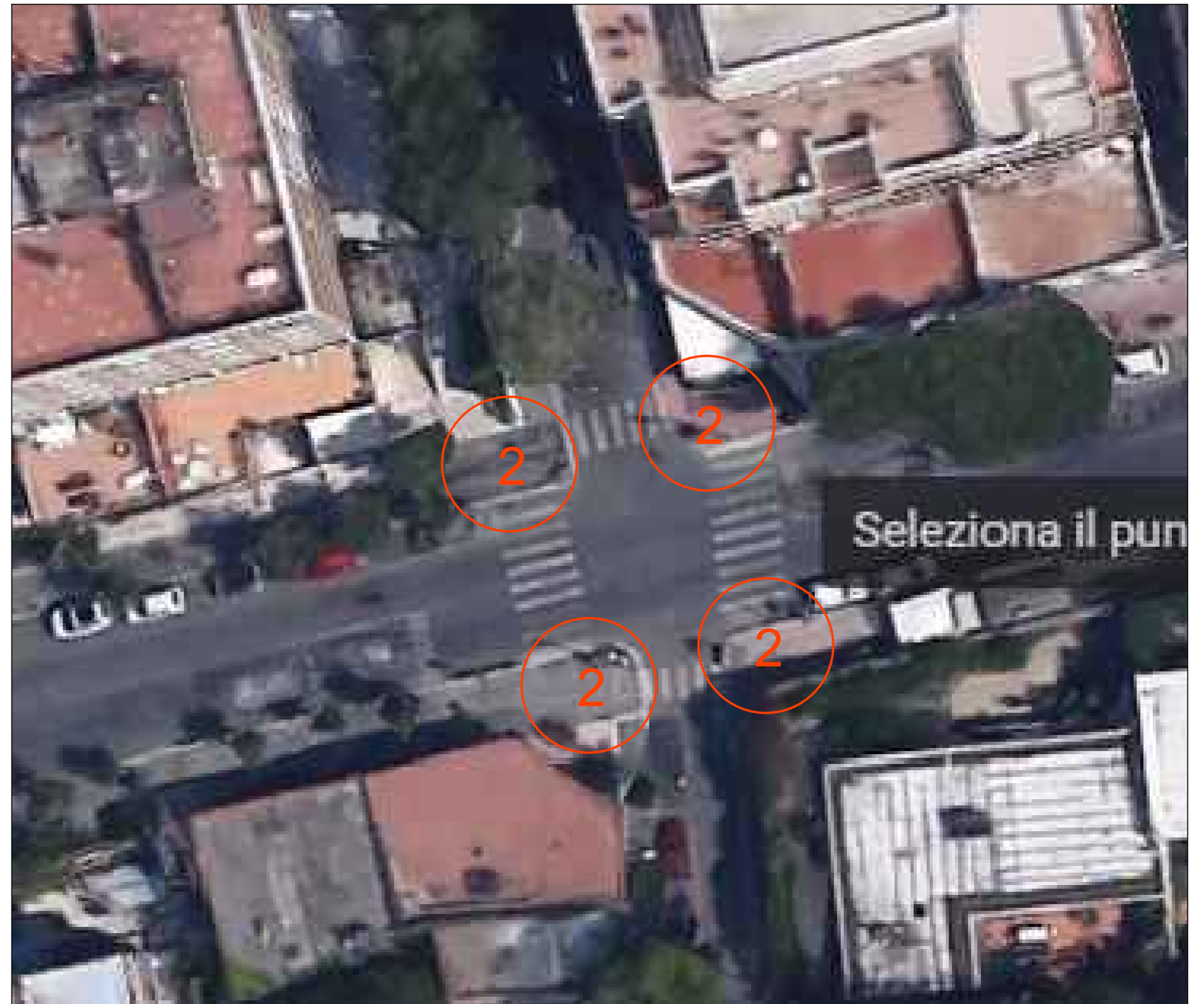
B - Planimetria Incrocio Via Aurelia - Via F. Crispi - Scala 1:200